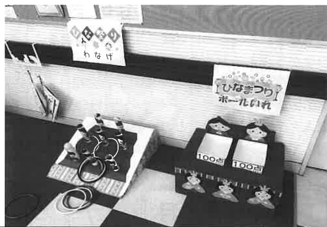
3月3日開催の「つどいの場ひな祭り」の様子