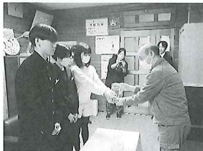
〈学校募金〉 ▼江差北小学校児童会様 ▼江差北中学校生徒会様