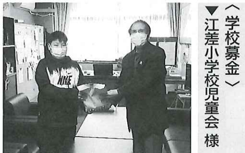
〈学校募金〉 ▼江差小学校児童会様