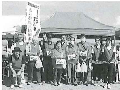
〈街頭募金〉 ▼9月28日(日) 江差町産業まつり