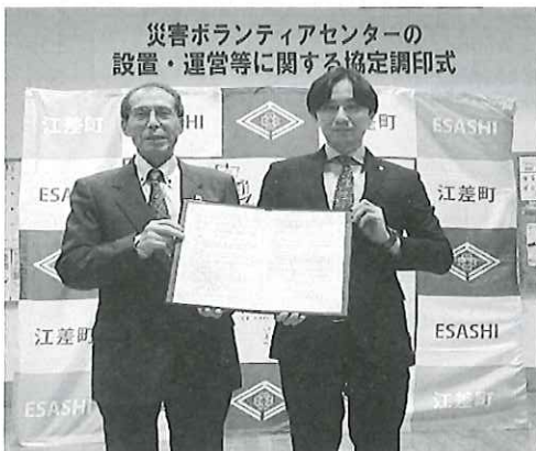
（左）社協片石会長（右）照井町長様