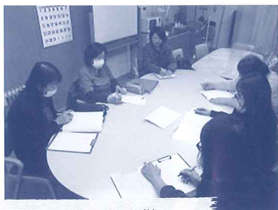
カンファレンスの様子