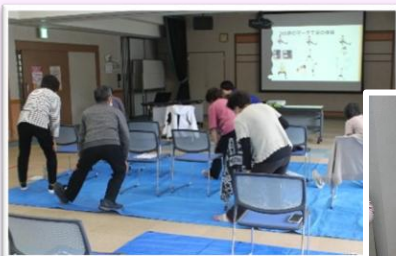
▲ミニ講座(足育講座)