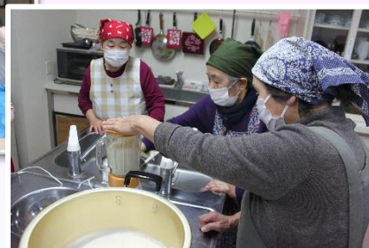
▼ミニ講座(豆腐作り)