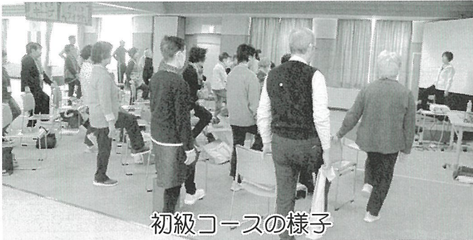
初級コースの様子

なお、令和8年度も前年度同様に開催いたしますが、募集につきましては、大変好評につき既に終了しておりますので、ご了承ください。