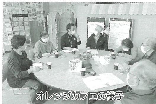
オレンジカフェの様子