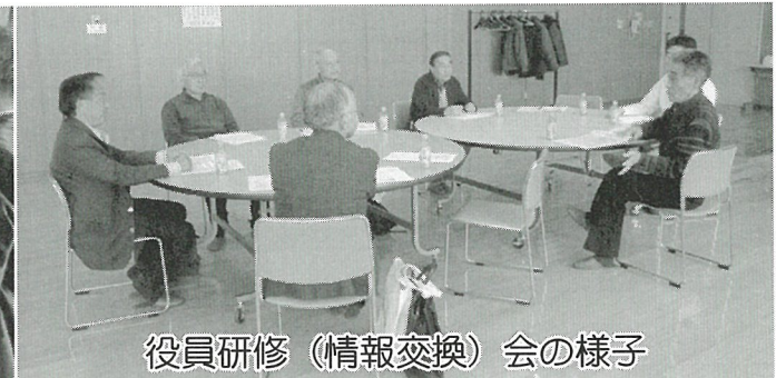
役員研修（情報交換）会の様子