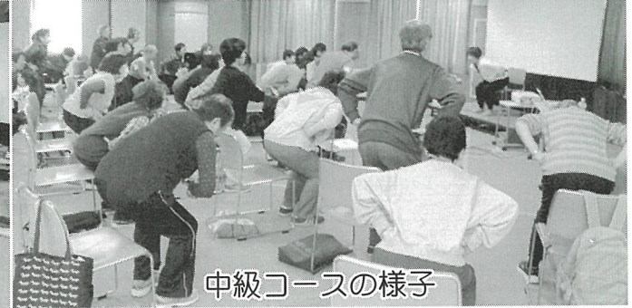
中級コースの様子