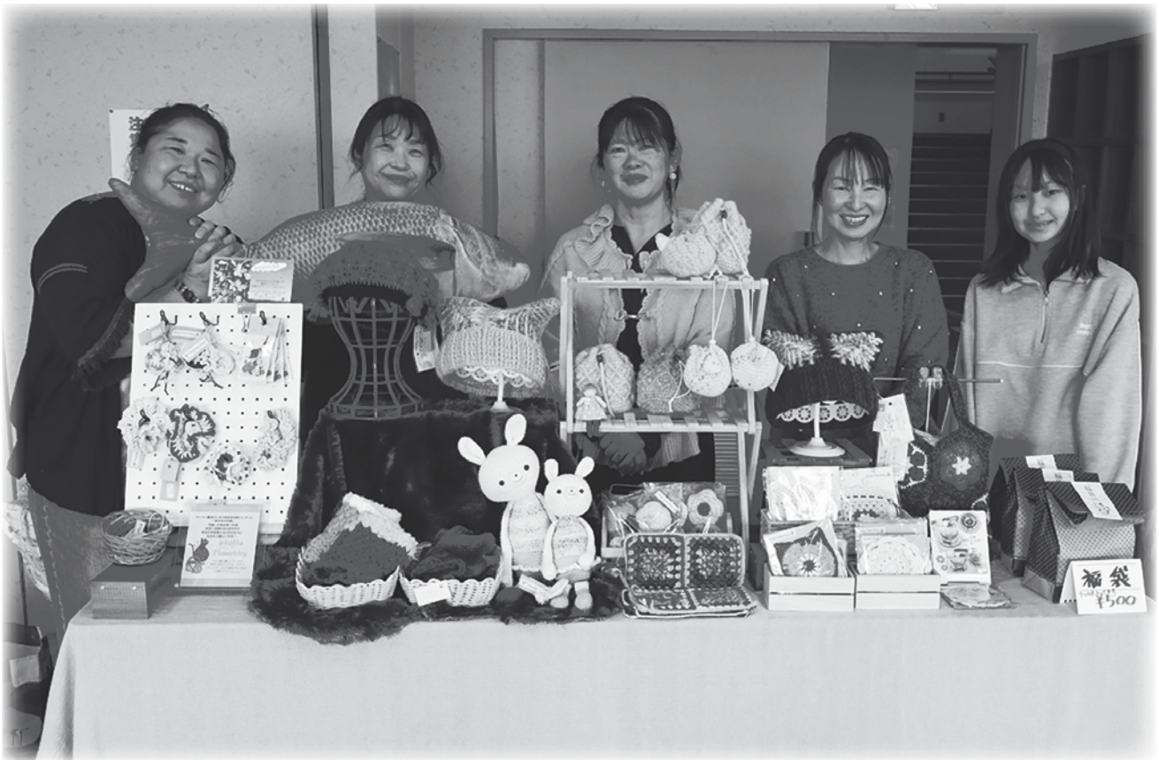
「標茶はんどめいどくらぶ」