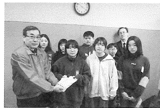
< 別保小学校 >