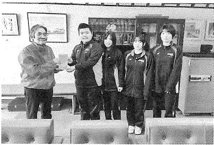
< 遠矢中学校 >