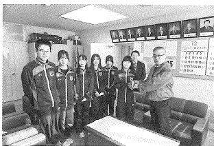
< 富原中学校 >