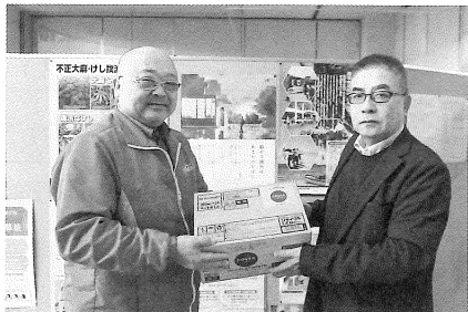
北海道コカ・コーラ ボトリング様