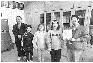
< 昆布森小学校 >