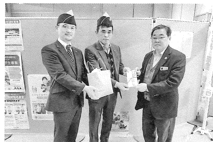
釧路湿原 ライオンズクラブ様