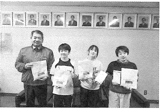
< 遠矢小学校 >