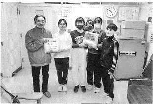
< 富原小学校 >