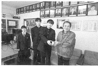
< 昆布森中学校 >

今年度も多くの学校の皆さまから募金が寄せられました。各学校において児童会や生徒会で呼び掛けを行い、募金を集めてくれました。集まった募金は大切に活用させていただきます。