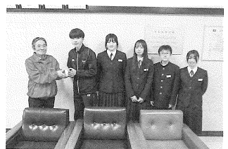
< 別保中学校 >