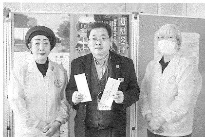
釧路町 赤十字奉仕団様