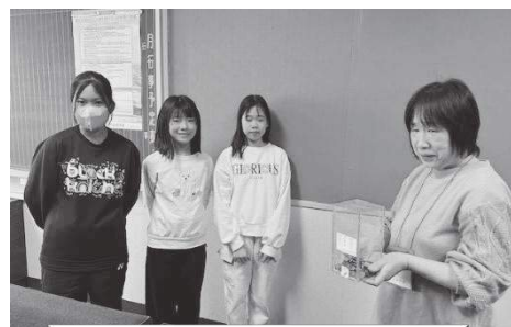
更別小学校 … 4,310円