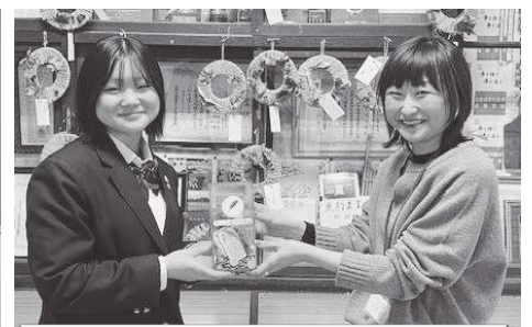
更別農業高等学校 … 4,941円