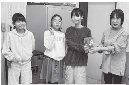
上更別小学校 … 1,637円