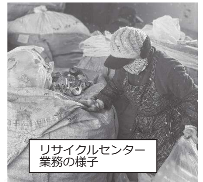
リサイクルセンター業務の様子

作業に伺ったお宅での「ありがとう、またよろしくね」とのお声掛けや、リサイクルセンターでの「お疲れ様」などの労いの言葉がとてうれしく、やりがいにつながっています。ぜひ一緒に働く仲間になってくれませんか？