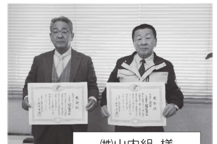
(株)山内組 様 (株)ティー・ワイ 様