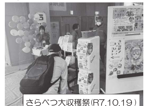
さらべつ大収穫祭(R7.10.19)

集まった募金の約9割は来年度村内の福祉活動に助成され、残りの1割は北海道規模の福祉助成(赤い羽根の車輛など)や、国内の災害支援のために使われます。