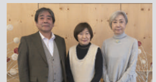
東川町赤十字奉仕団様

東川町で安心してお正月を迎えていただくため、歳末の時期に重点的に行う募金運動を実施しました。皆さまのご協力により、多くのご寄付が集まりました。心より感謝申し上げます。