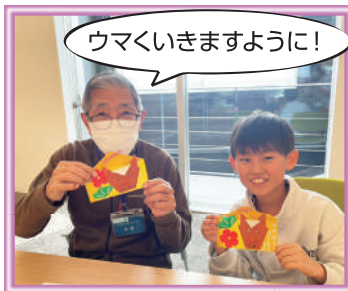
ウマくいきますように！

1月から冬グループがスタートしました！ 1回目は、そらいろKIDS達というんなお正月遊びをして、一緒にお弁当を食べて、たくさん笑ってとても楽しい時間となりました！