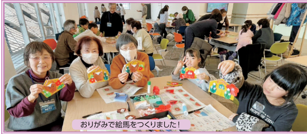
おりがみで絵馬を作りました！