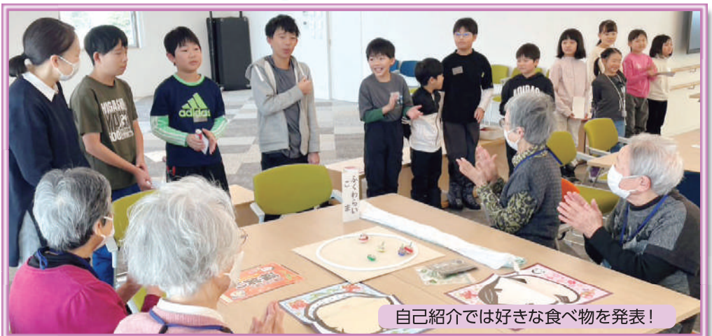
自己紹介では好きな食べ物を発表！