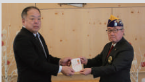
東川ライオンズクラブ様

赤十字奉仕団、ライオンズクラブ、民生委員児童委員互助会、第一小学校、大雪ふれあいクラブ、北辰クラブ、西部ゆうあいクラブ、寿あじさいクラブ、東川町社協役員一同、そらいろ社協窓口、そらいろクリスマスマーケット、東川国際文化福祉専門学校学生自治会、個人3件