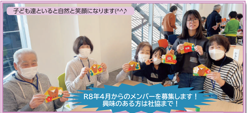
R8年4月からのメンバーを募集します！ 興味のある方は社協まで！