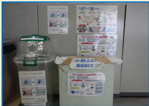
リングプル・ペットボトルキャップ回収事業