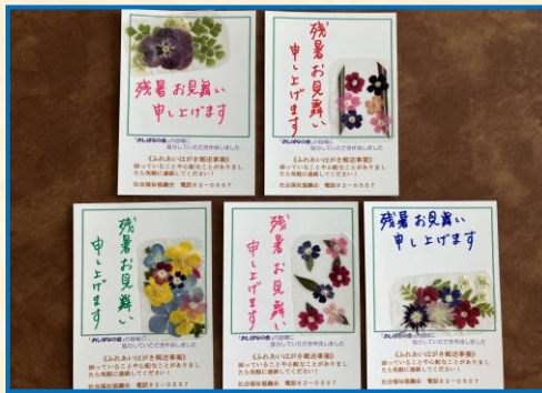
ふれあい葉書郵送事業