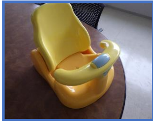
ベビーバスチェア