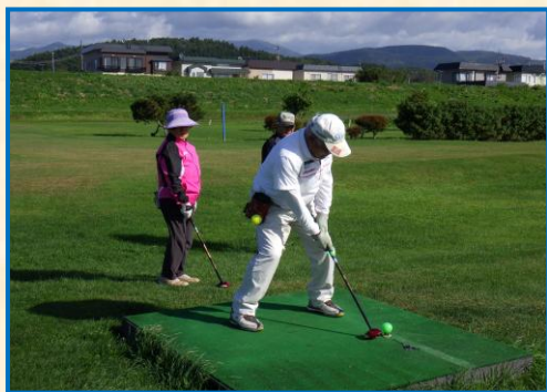
ふれあいパークゴルフ大会