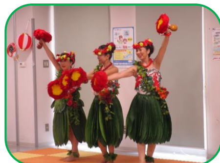
今金オールフラダンスサークルの皆さんが華麗なフラダンスを披露してくれました👏