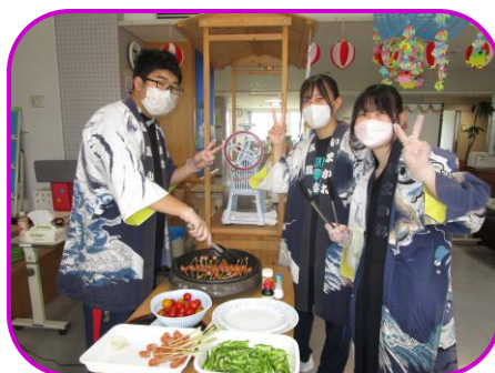
檜山北高ボランティア同好会の学生さんが手伝ってくれました