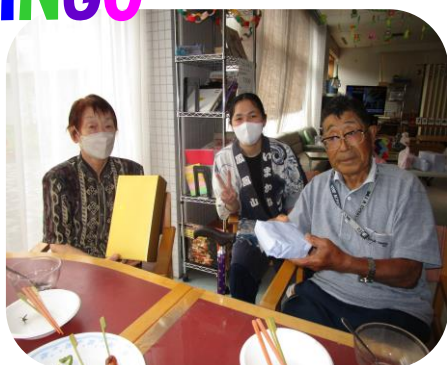
ビンゴ大会で、景品当たりました◎