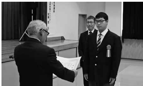
表彰を受ける北海道雨竜高等養護学校生徒代表