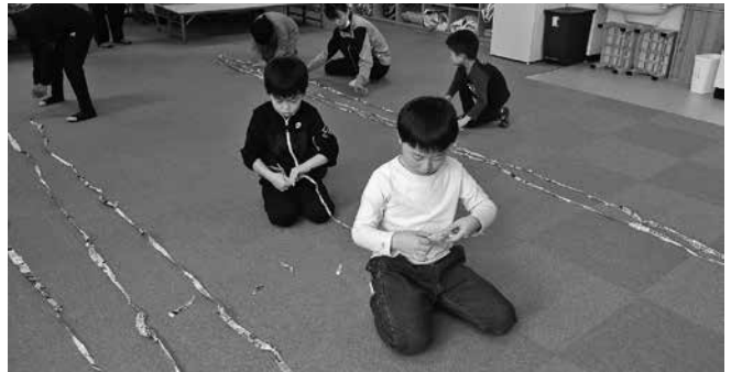
学童保育所行事（集団遊び）