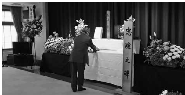
献花するご遺族様

令和7年6月16日、町社会福祉協議会主催による戦没者追悼式が、会場を神社境内より、いきいき館に移し行われました。追悼式では、ご遺族、町長をはじめ各団体長、当社会福祉協議会役員の総勢21名が献花を行い、無念のうちに戦争の犠牲となられた方々を慰霊するとともに、本年は終戦から80年を迎え、戦後世代が多くなる中で、戦争の悲惨さを語り継ぐ使命と平和への思いを新たにしました。