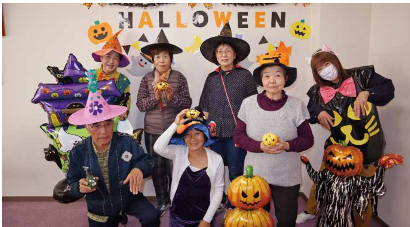
(R6.10.31 ボランティアカフェ/ハロウィンイベント)

TEL 77 - 2228 FAX 77 - 2218 E-mail : shakyo@shakyo.town.uryu.hokkaido.jp