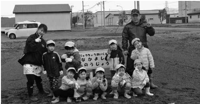
食育事業（イモ植え）