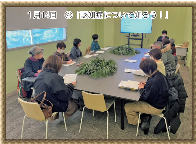
1月14日 ④「認知症について知ろう!」