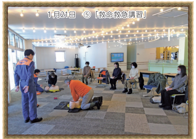
1月21日 ⑤「救命救急講習」

みまもりサポーター養成講座、プログラム④・⑤を実施しました。ご参加いただいた皆様ありがとうございました!