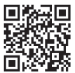
▲ホームページ QRコード