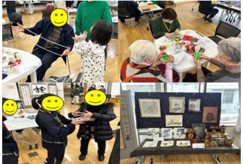
▲ どなたでもカフェの様子