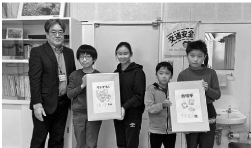
北広島市双葉小学校児童会