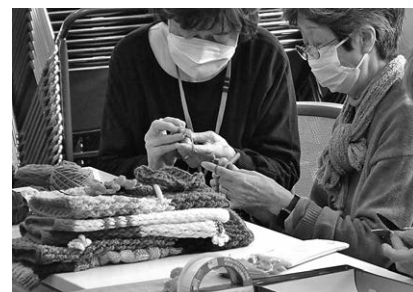
R6.4 認知症マフ制作の様子