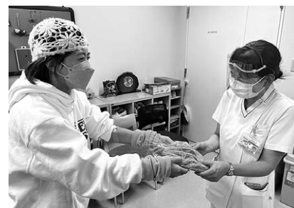
R5.12 KKR札幌医療センターへの寄付の様子