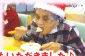
ケーキもいただきました♪