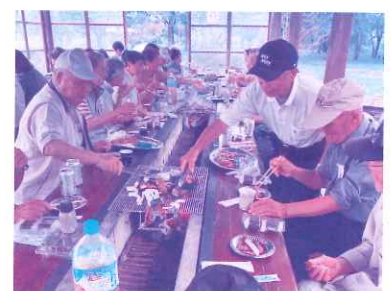
7月29日 老人クラブ・身障協会 合同焼肉パーティー