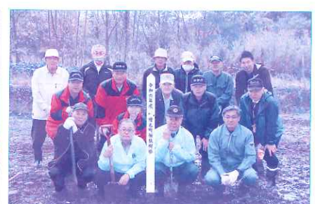
10月31日 生きがい事業団 明和園桜植樹