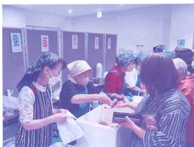
食べ物コーナーも行列ができました

福祉チャリティーふれあいパーティーが令和6年10月5日(土) 増毛町文化センターにて開催されました。300人以上もの町民の皆さんが、カラオケ大会や抽選会を大いに楽しみました。おかげさまで社会福祉協議会に約24万円の善意の寄付金をいただき、関係各位に心よりお礼申し上げます。