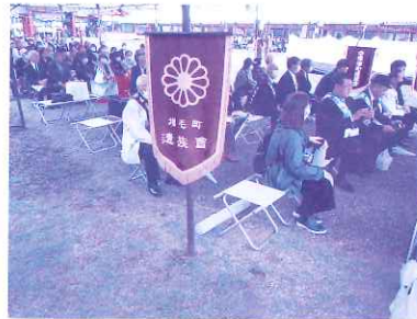
6月5日 遺族会 護国神社参拝