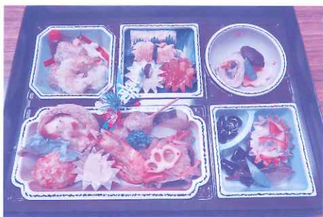
おせち料理配送 ボランティアにより12月30日に届けられました。