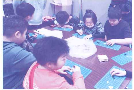
カタクキにじっくり向き合いました