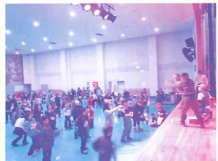
フィナーレのもちまき