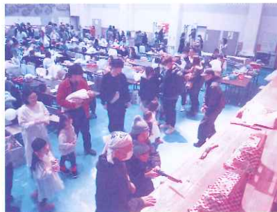
射的コーナーには行列ができていました