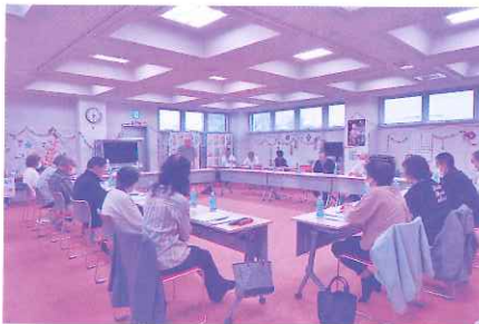
6月25日 評議員会の様子