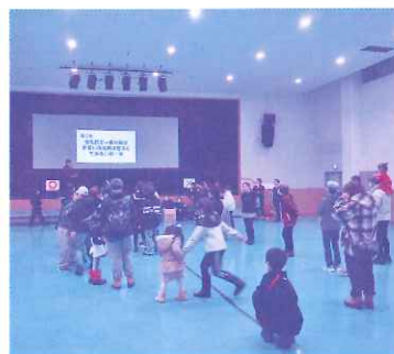
増中学生会による〇×クイズ