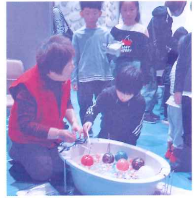
ヨーヨー釣りも人気！