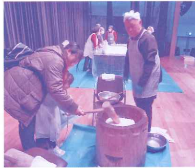
もちつきべったんおいしくな〜れ