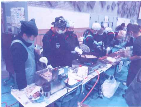
中学生のお手伝いも大活躍！