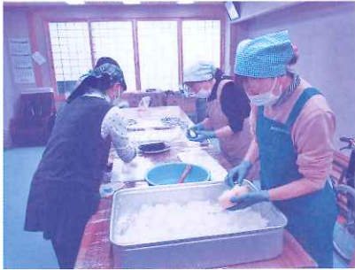
ボランティアさん おにぎり準備中

オープニングセレモニーではこども園あつぷるの皆さんのかわいらしいお遊戯、くだおれ横丁でお腹を満ちし、体験の広場やふれあい交流会では世代間をつなぐ交流ができたと思います。閉会式には待ちに待ったもちまき大会。昨年を上回る来場者数と盛り上がりで活気にあふれる一日となりました。足下の悪い中、ご来場の皆さん、ボランティアの皆さん、ありがとうございました！