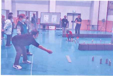
5月23日 生きがいデイサービス モルック大会

コロナ禍を過ぎ、おおむね従来の活動が戻ってきました。人と顔を合わせられる、対話できる喜びを感じながら、各種事業を継続していきたいと思っております。皆さまのご参加・ご協力をよろしくお願いいたします。