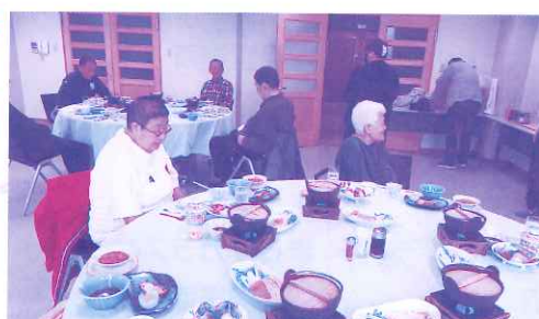
10月21日 身障協会研修旅行