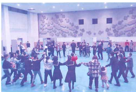
世代を越えてフォークダンス