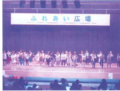
こども園あつぷる お遊戯