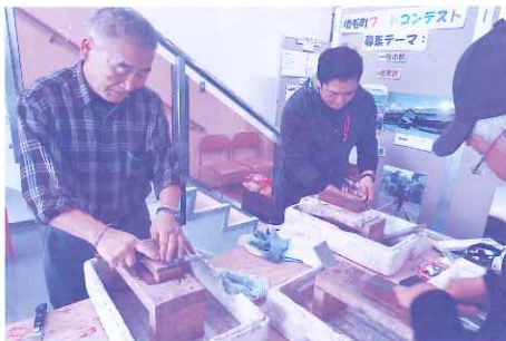
技能士会による包丁研ぎ