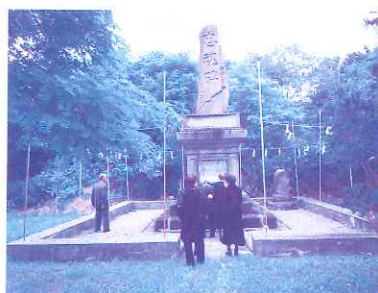
8月15日 英霊を忍ぶ会 忠魂碑参拝