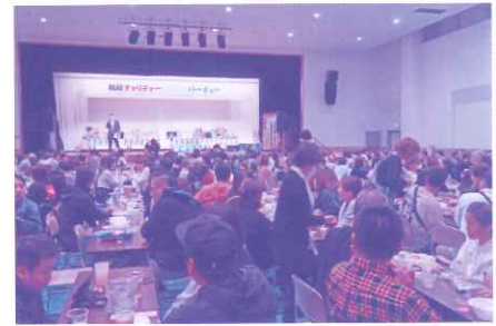
たくさんのご来場ありがとうございました