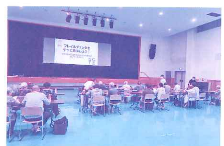
9月12日 生きがいデイサービス 健康教室