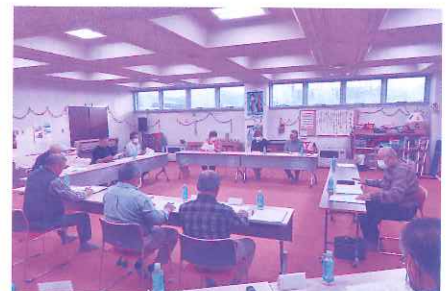
6月11日 理事会の様子