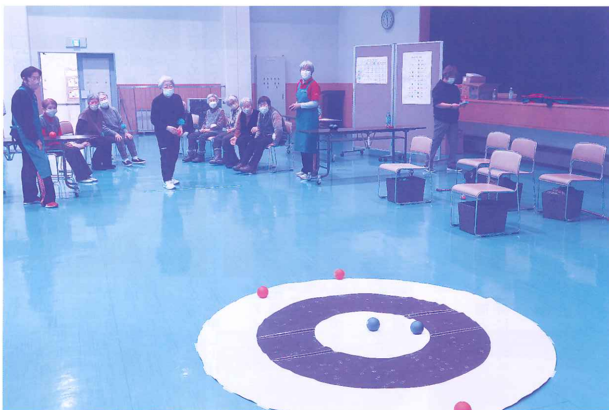
生きがいデイサービス お楽しみ会 ゲーム大会