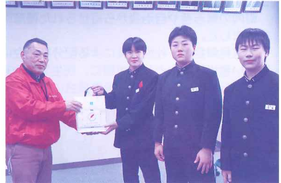
増毛中学校生徒会書記局のみなさん