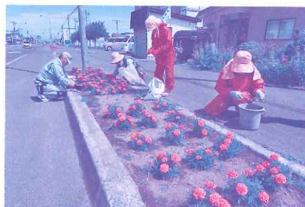
6月27日 生きがい事業団 花壇草取り