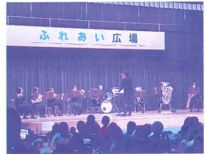
増中吹奏楽部の演奏