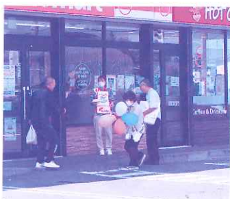
10月1日 赤い羽根街頭募金