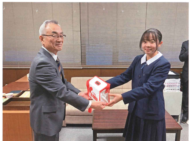
蘭越中学校歳末たすけあい募金 (12 月 10 日 / ふれあいプラザ21)