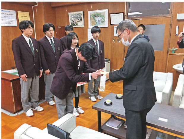
蘭越高校歳末たすけあい募金 (11 月 28 日 / 蘭越高校)