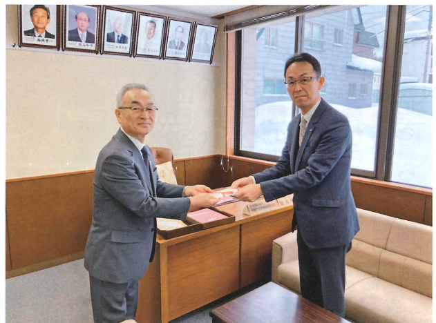
ひまわり財団助成金伝達 (12 月 19 日 / ふれあいプラザ21)

雇用期間：令和 7 年 4 月 1 日より令和 8 年 3 月 31 日まで（雇用延長可能） 勤務予定：週 1 日木曜日（9 時～11 時 30 分・ 15 時から 17 時 30 分）計 5 時間 臨時的に火曜日・土曜日交代あり 時給：令和 6 年度実績（1,729 円 / 1 時間） 休暇：有給休暇あり 資格：運転免許及び福祉有償運送運転者 講習資格（資格講習を受講） 申込期限：令和 7 年 2 月 20 日（木）まで 問合せ：蘭越町社会福祉協議会 中田（電話 5 7 - 5 2 0 3）