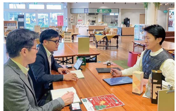
Route148における社会福祉法人愛敬園職員との打ち合わせ

関はもちろん、学校や民間企業、そしてNPO法人やボランティア団体など、分野や業種を超えて、地域全体の福祉を切り開いていくことが期待されます。