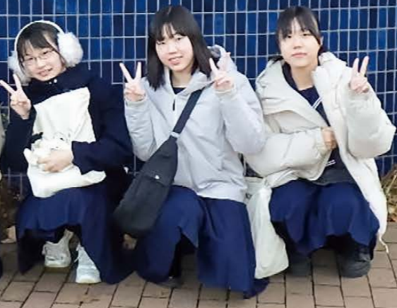
日章中学校の生徒たちと