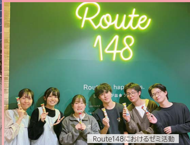
Route148におけるゼミ活動

体、福祉に関心がある人々の力だけではなく、これまで福祉とは縁がなかった人たちの力も集結していくことが必要不可欠といえるでしょう。