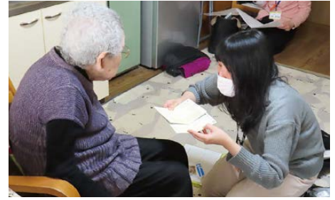
実際の支援の様子

この事業では認知症や知的・精神障がいなどにより、一人では日常生活を送ることに不安のある方が、地域で安心して生活を継続できるように権利擁護や自立支援を進めています。支援の内容としては、福祉サービスの利用にかかわる手続き、情報提供の他、日常的な金銭管理や財産保全(貸金庫で重要書類等をお預かりする)など、利用を選択できるサービスも提供しています。利用に関する詳細は、お住まいの区の社会福祉協議会、または札幌市社会福祉協議会自立支援課までお問い合わせください。