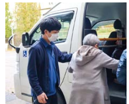
デイサービス送迎の様子

また、相談員業務としては対象となる利用者の方がどうしたら健康に暮らしていけるか、一人ひとりからお話を伺ったり、専門職が集まる会議に出席して話合っています。会議では当館をより有効に活用してもらうにはどのようにしたら良いかを一緒に考えたり、必要な情報共有も行われています。