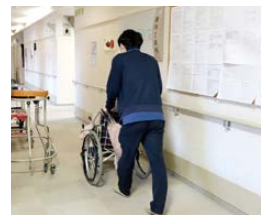
利用者の方の支援の様子