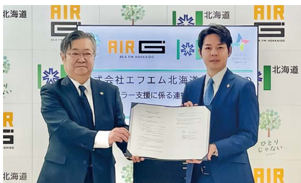
北海道との連携協定締結式

「ひとりじゃない プロジェクト」は、放送局、行政、民間企業が手を取りあって、ヤングケアラーの周知拡大と実質的な支援の輪を広げていくことを目指しています。