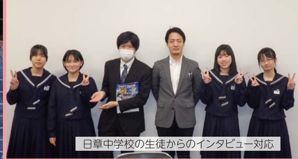
日章中学校の生徒からのインタビュー対応