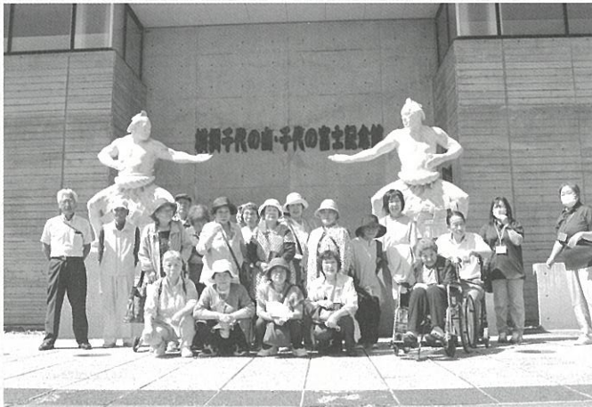
横綱千代の山・千代の富士記念館