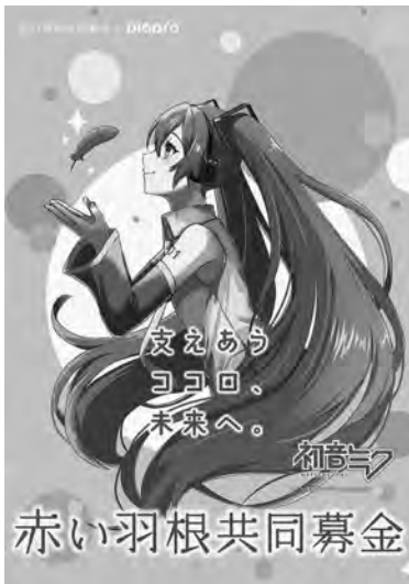
Art by 葉月幹 © CFM