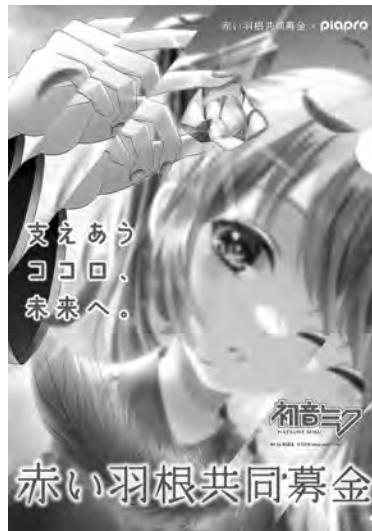
Art by めばえ