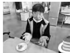
かぼちゃ団子を手作り