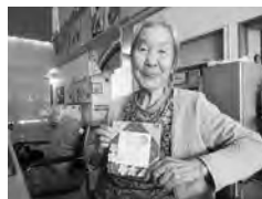
敬老の日のお祝いカード