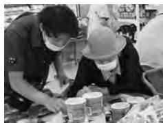
お買い物ツアーの日