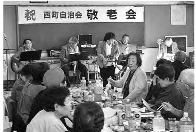
(写真は西和福原・西町自治会で記念品をお届けしている様子)