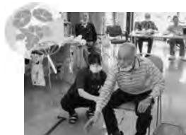
夏まつりの的あてゲーム