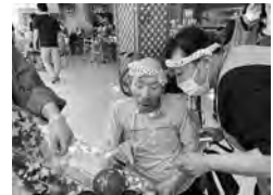
お好きな色のヨーヨーは？