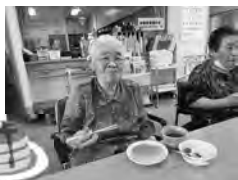
ホットケーキの日