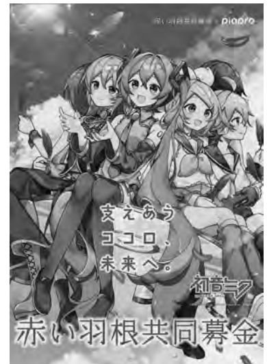
Art by さざなみ © CFM