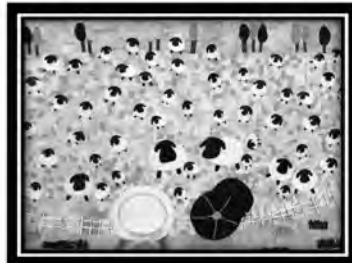
町民文化祭に出展しました！