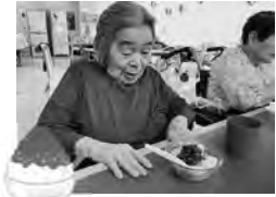
夏の定番かき氷にあんこのトッピングが