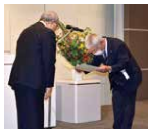
受賞者には表彰状が贈られた

ことが求められている。道社協としても、多岐にわたる福祉課題の解決に取り組みながら、本道の地域福祉の推進に全力で取り組んでいく。」と式辞が述べられました。