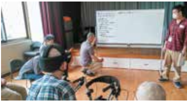
SST(ソーシャルスキルトレーニング)による生活訓練の様子

地域生活を目指して生活訓練を行う居宅生活訓練事業、地域移行後の生活や地域で暮らす障がい者や生活困窮者を支援する保護施設通所事業、一時入所事業、生活困窮者認定就労訓練事業などを行っています。