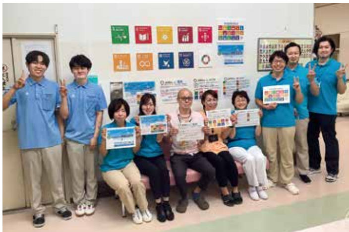
当法人の職員と北海道介護福祉学校の実習生

このように、私たちの取り組みをSDGsの理念を通して発信することは、法人のブランディングにつながり、福祉の仕事のやりがいや魅力