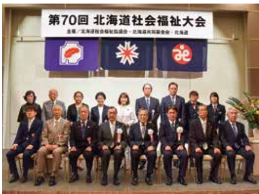
表彰者・受賞者による記念撮影