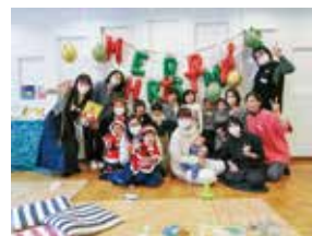
「ママカフェ」クリスマスパーティーで全員集合