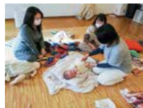
「ママナレッジ」で正しい抱っこを学ぶ

今後も、子育て中の女性や子どもたちが笑顔で暮らし、未来をつくる子どもたちが健やかに育つため、取り組みを行ってまいります。