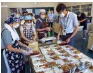
地域食堂「ほっこり」の準備中