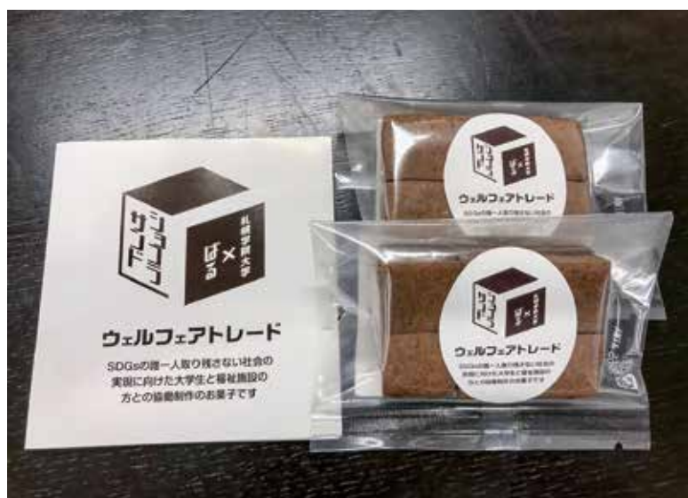
ウェルフェアトレードのお菓子「ショコラサンド」

に配慮した商品を選択することにより、より社会的意義のある事業活動への変革が促され、持続可能な生産と消費の連関が生まれます。その結果として、より豊かで成熟し、すべての人が生活しやすい社会が形成されていくのです。