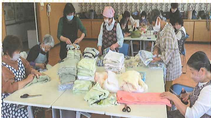
古布加工のようす

ボランティアグループ「あゆみ」では会員相互の親睦交流を深め、独自の活動を高めるとともに、ボランティア精神の高揚を図ることを目的に活動しています。主な活動は新冠町社会福祉協議会のひとり暮らしふれあい会食会、年越会の企画や運営、預託品で寄付された古布の加工や配布、小物作り等を会員14名で自分たちが出来る範囲で楽しく活動しています！