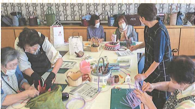
小物づくりのようす