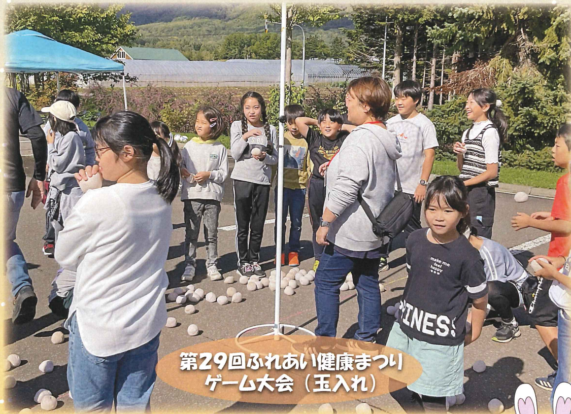
第29回ふれあい健康まつり ゲーム大会（玉入れ）