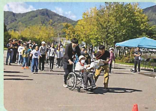
そろりとまいろう