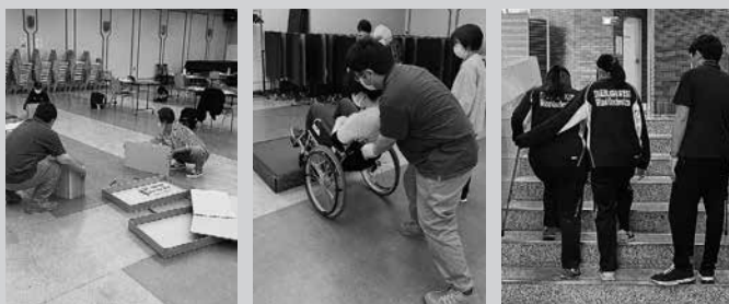
講義・演習の様子