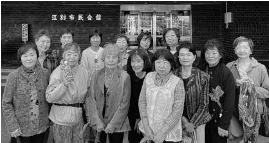
(上) 愛ランドに参加された皆さまの集合写真 (右) 道新ボランティア奨励賞一般奨励賞を受賞された『江部乙まちづくりコミュニティ行動隊女子部』の皆さま、ご受賞おめでとうございます。