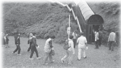
防災シェルター内の様子

令和6年度は、6地区を予定しております。自治会内で、イベント等をお考えでしたら、随時申請を受け付けておりますので、是非、ご活用ください。