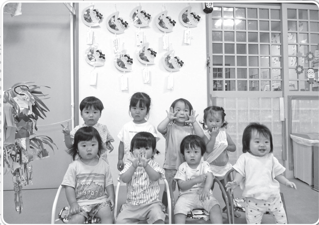
小平幼児センター 七夕まつり会