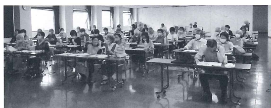
7月27日 暮らしの講座の様子