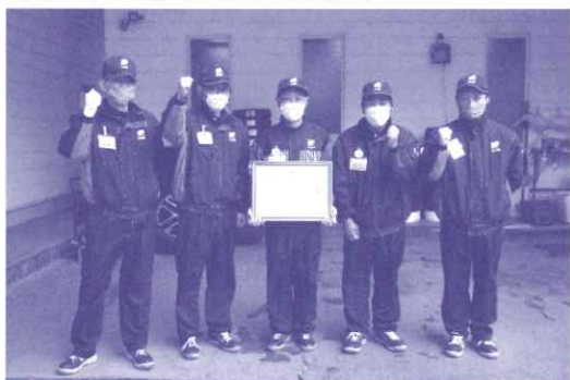
株式会社キタセキ駒ヶ岳給油所 様