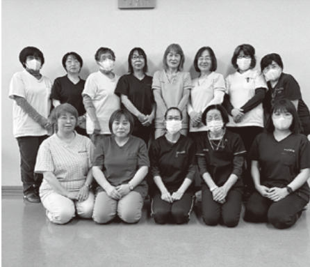
▲訪問介護事業(ホームヘルパー)