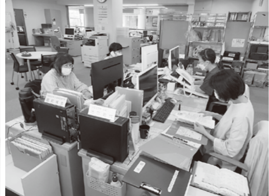
▲居宅介護支援事業(ケアマネジャー)

【介護事業】 訪問介護事業・福祉有償運送(移送)事業・自費サービス事業・障がい者居宅介護事業・移動支援事業・受託居宅介護サービス事業・居宅介護支援事業・介護予防支援事業・要介護認定訪問調査事業・小規模多機能型居宅介護事業