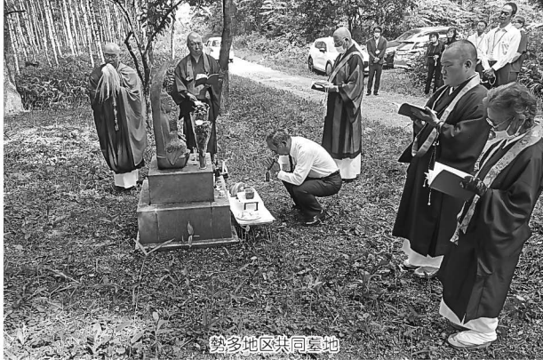
勢多地区共同墓地