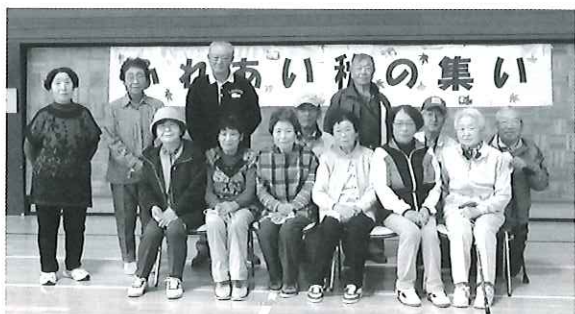
身障「ふれあい秋の集い」の様子