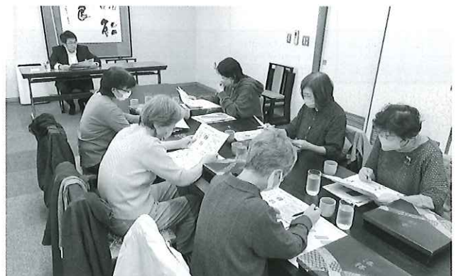
在宅介護者支援 「いきいき交流 虹の会」勉強会の様子