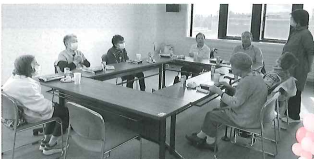
枝幸町ボランティア連絡協議会 ふれあいサロンの様子