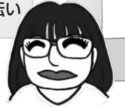
宮井コーディネーター

ボランティア活動に関心のある40歳以上の皆さま、滝川市ボランティアセンターに登録をして支えあい手帳をぜひご活用ください!