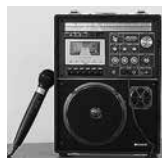
ポータブル マイクセット