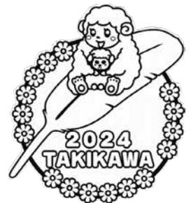
2024ピンバッジ イメージ図

(過年度のバッジをご希望の方は在庫が残っている場合がございますので、事務局にお問い合わせ願います。)