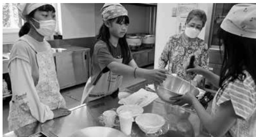
ホットケーキづくりで世代間交流

ゴミ出し支援やボランティアカフェのお手伝いなど簡単なお仕事ですので、ボランティアに興味のある方の応募をお待ちしています。