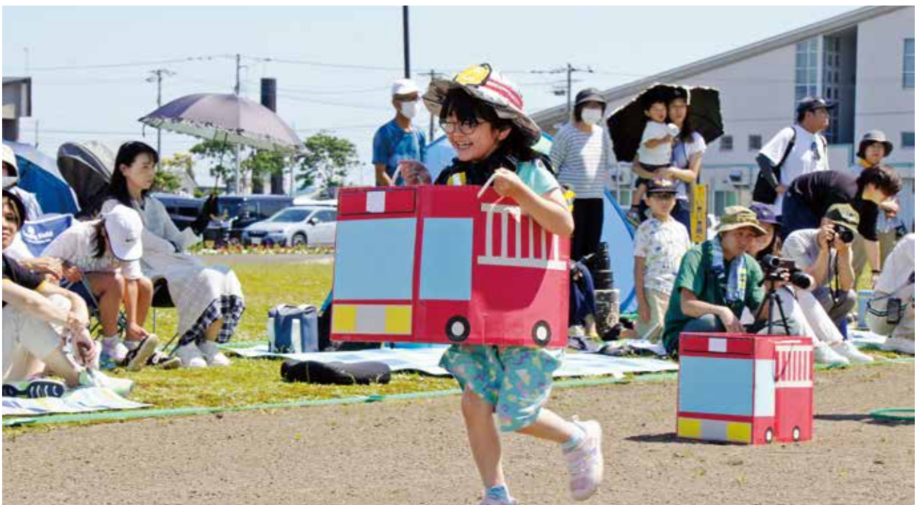
(6.29 保育園運動会 ちびっ子消防士出動!!)