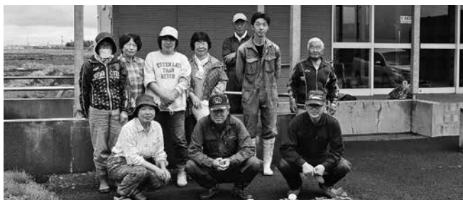
(第1町内の1 南竜コミセン 令和6年6月6日)

町社会福祉協議会では、例年、明るい街づくりの一環として「環境美化花いっぱい運動」を実施しています。今年も第1町内の1、第2町内の1・2・3、第3町内(川上地区)、第5町内の1・2、第6町内の1・2、第11町内の各地区のみなさんの協力により、それぞれのコミュニティセンターなどの花壇に花植えを行っていただきました。また、老人クラブ連合会では会員66名が参加して、雨竜市街、追分市街の国道沿いに赤橙混合色のマリーゴールドの花苗の移植と、その後の管理作業として草取りも行っていました。いずれも、地域の方々や道行く人の目を和ませています。