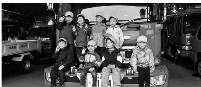
(防火学習会 令和6年5月)