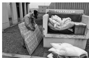
ゴミ出し支援の様子

ゴミ出し支援やボランティアカフェのお手伝いなど簡単なお仕事ですので、ボランティアに興味のある方の応募をお待ちしています。