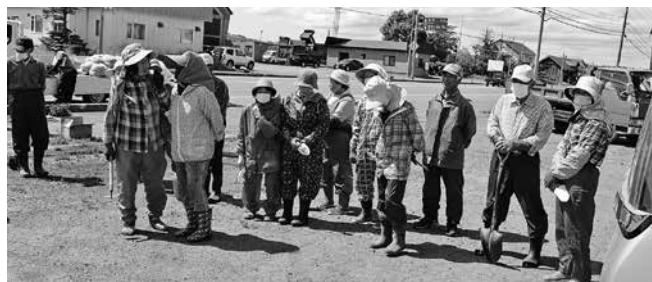
(老人クラブ 追分市街 令和6年6月7日)