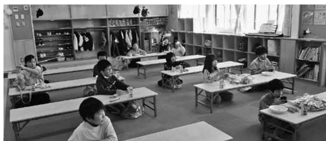
(進級を祝う会 令和6年3月)