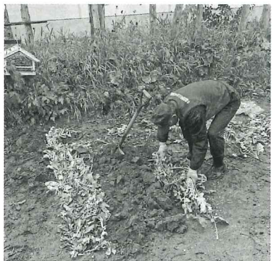
家庭菜園の片付け