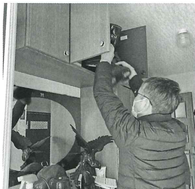
下足棚の靴入れ替え