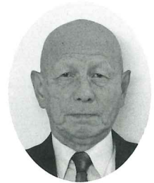
社会福祉法人 中富良野町社会福祉協議会