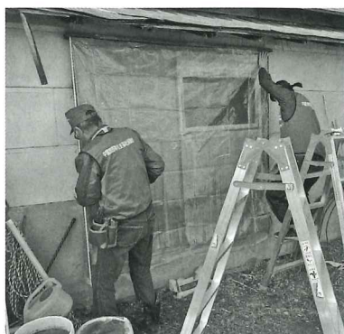
窓枠のビニール貼り