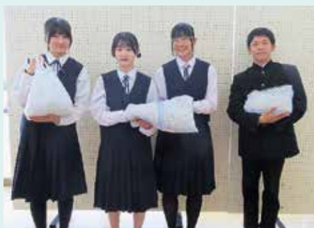
中春別中学校の皆様

令和6年6月6日、別海町立中春別中学校の皆様から車いす交換に役立てて欲しいとリングプルの寄贈がありました。 全校生徒から集めていただいたリングプルの総重量は6.2kgでした。 中春別中学校の皆様、収集ボランティアに協力いただきありがとうございました。