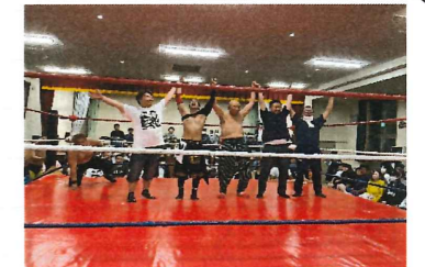
○チャリティープロレス協賛