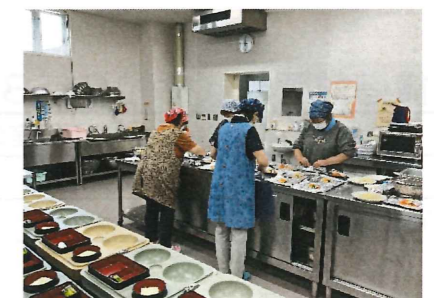
○配食ボランティアの会 年50回 延1,024食 ボランティア参加 延223名