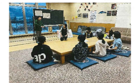
○赤井川手話会 手話講習会