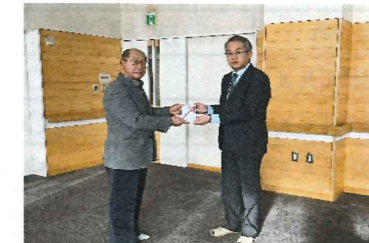
○北海道信用金庫ひまわり財団助成金贈呈