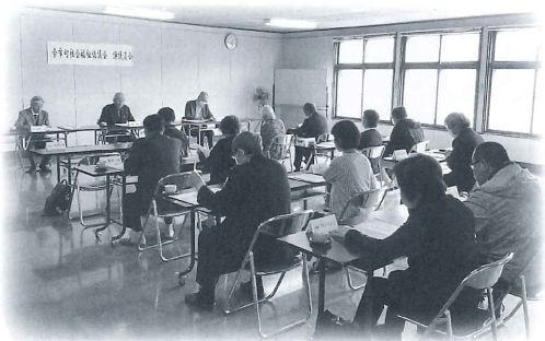
5月24日開催の「定時評議員会」で議決