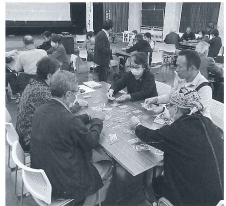
▲手伝ってほしいことが書かれたカードをやり取りする参加者の皆さん （令和5年10月14日開催「お互いさまの地域を育むために2023」より）