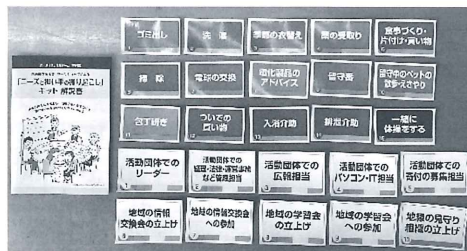
▲新・助け合い体験ゲームのカードセット