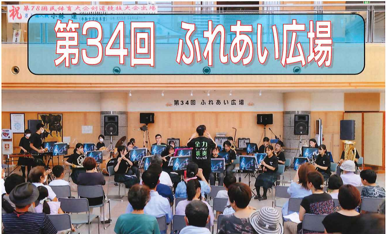
平取中学校吹奏楽部の演奏を皮切りにスタートしました♪ (上)