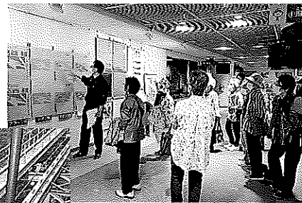
藻岩山は中腹からケーブルカーに乗り換えます(左)