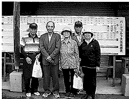
雨天予報の中、空を眺めながらのプレーとなりました。