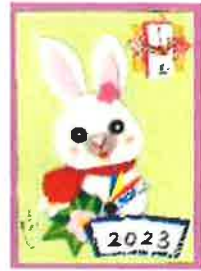
◀ 昨年度のデザイン （千支の卯をイメージ）

昭和63年にボランティアアシスタントさんが活動を開始しており、今年でなんと36年目にもなる地域の皆様に愛されるご長寿事業です。