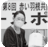
大中山地区 優勝者

第8回 ニュースポーツ大会が11月15日に大中山コモン、翌16日に大沼婦人会館、24日にスポーツセンターで行い、3地区で87名の参加者が6種目の競技に挑戦し、60,000円が寄付されました。