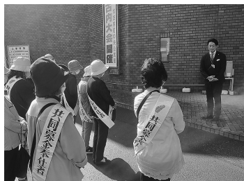
▲鈴木町長より激励の挨拶