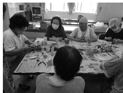
▲「かようサロン」の事業にも活かされています