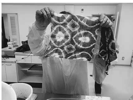
▲社協の「ものづくりサロン」や