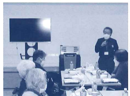
最後はビンゴ大会で盛り上がりました。