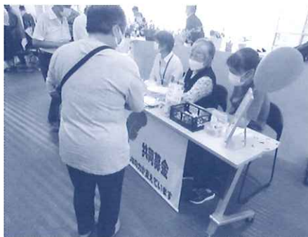
ボランティアの方も募金活動 頑張ってくださいました