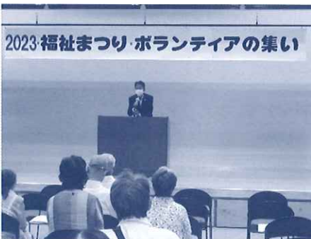
4年ぶりの福祉まつり開催です