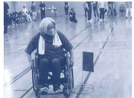
ジグザグ走行の車いすリレー