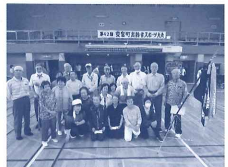
優勝は、四町内・目梨別・兜沼・西豊富 黄色チームでした