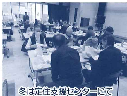
冬は定住支援センターにて 会食をしました。 みんなで食べると美味しい!