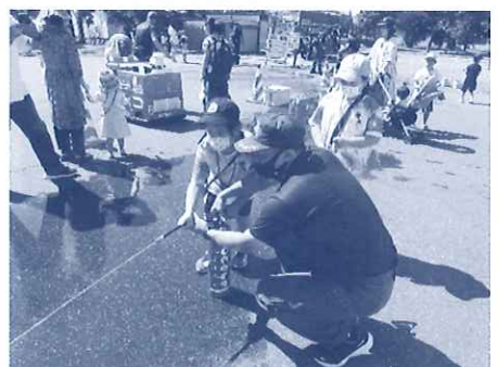
消防フェア同日開催 子ども達も楽しんでおりました