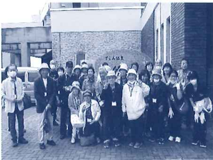
みんなで集合写真