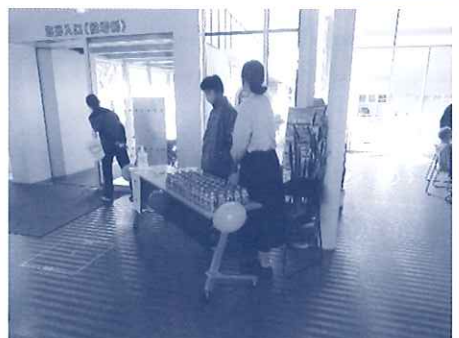
豊富高校生はお茶の配布や 参加賞の軽食配りを手伝って いただきました。