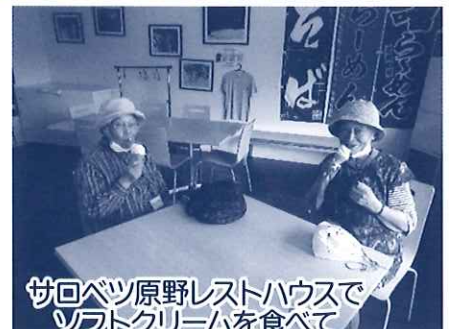
サロベツ原野レストハウスで ソフトクリームを食べて 帰ってきました。