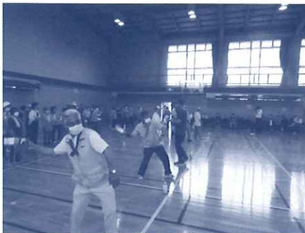
天まで届け牛乳パック投げ