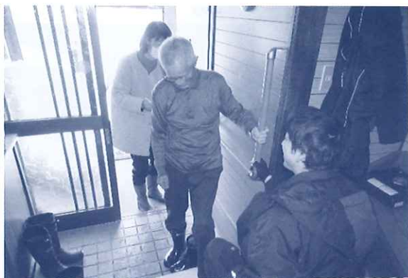
住宅改修(手すりの取り付け)を計画し安全に移動できるようになりました。