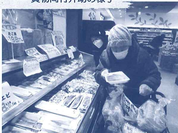
買物同行介助の様子