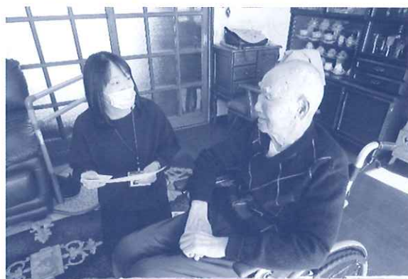
ご本人の意向や生活状況を確認しケアプランに反映していきます