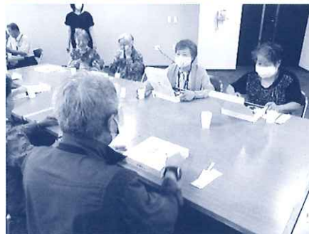
久しぶりの会食です