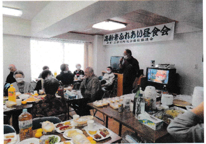
ふれあい昼食会の開催（町内8地区） 写真：東山地区