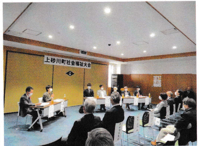
全町社会福祉大会の開催（10月28日）