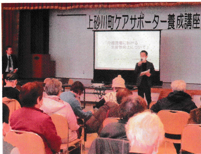
ケアサポーター養成講座の開催（全4回）