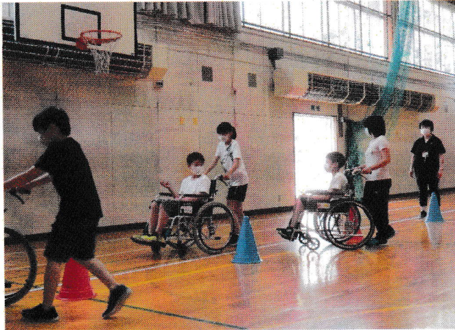
上砂川小学校での福祉授業の様子（7月20日）