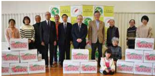
11月29日に、松禄神道大和山様よりリンゴの寄贈があるなど、市内でも支援の輪が大きく広がりを見せています。

※実施日時等については登別市ボランティアセンター（88-2080）までお問い合わせください。