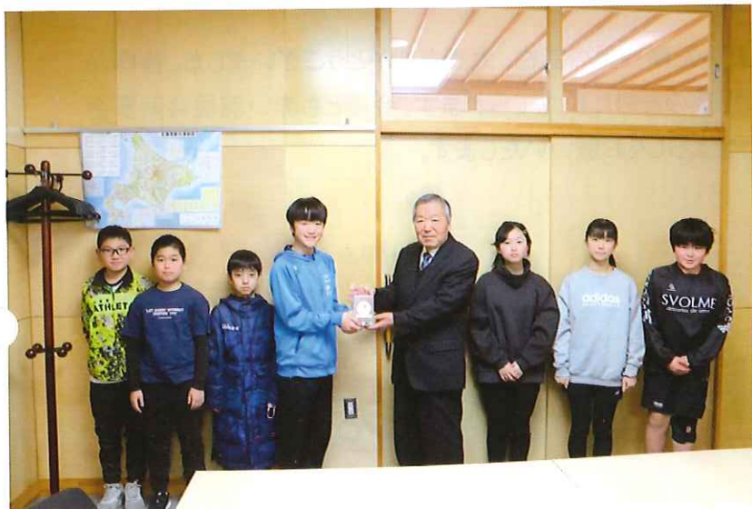
様似小学校児童会 様似中学校生徒会 による赤い羽根共同募金活動