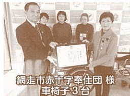
網走市赤十字奉仕団 様 車椅子3台

マルハン網走店 様 お菓子 網走駅 様 保存水 網走市赤十字奉仕団 様 車椅子3台 JAIFA釧路協会 様 タオル