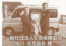
一般社団法人生命保険協会 旭川・北見協会 様