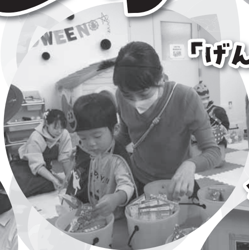
「げんきっず」の ハロウィン