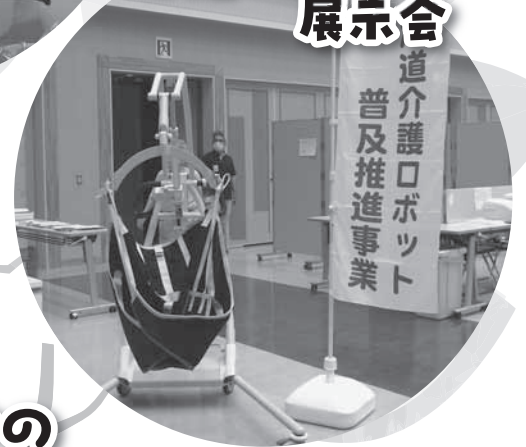
介護ロボット 展示会