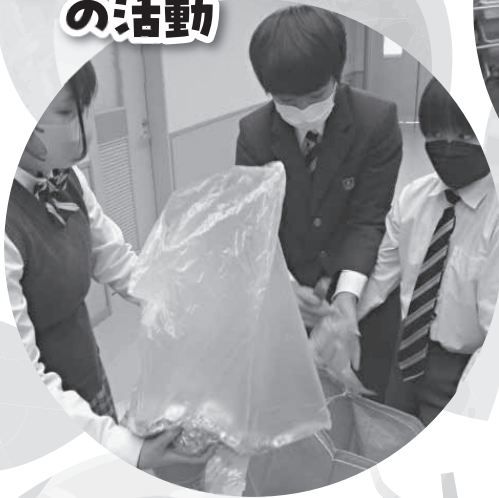
利尻中学校 の活動