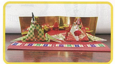
和紙による手作りのひな人形