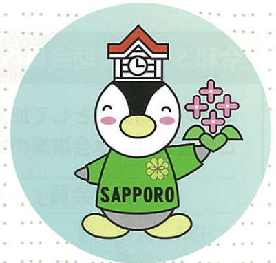
民生委員・児童委員 ご当地キャラクター「ミンジー」 札幌市版

困ったことや心配ごと、援助を必要とする相談には、住民の立場にたって対応します。行政や専門機関、ボランティアなど地域活動とあなたをつなぐパイプ役です。また、相談内容に応じて福祉サービスに関する情報の提供や、社会福祉施設や社会福祉に関する活動を行う人などとの連携で問題解決のお手伝いもします。