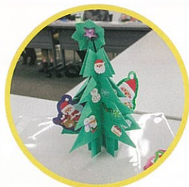
折り紙で手作りの クリスマスツリー

今後こうした、住民同士のつながりにより、お互いに困り事を気軽に相談できる関係づくりを行うための取り組みを進めていきます。