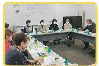
令和5年12月15日の発会式